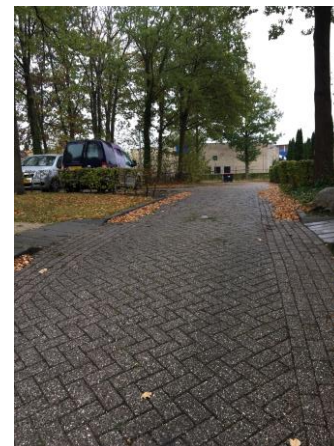
Figuur 2 parkeerterrein gemeentehuis