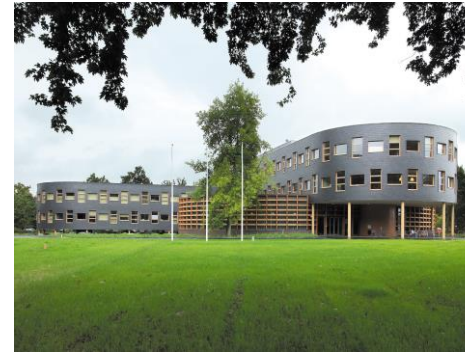
Figuur 1 gemeentehuis Ooststellingwerf

Het gemeentehuis van Ooststellingwerf is gevestigd in het noorden van de kern Oosterwolde. Bij een flinke bui bestaat het risico dat de parkeerkelder van de gemeente vol loopt. Tot heden zijn er geen wateroverlast situaties bekend bij de gemeente. Overlast zoals weergegeven in de stresstest is niet acceptabel.